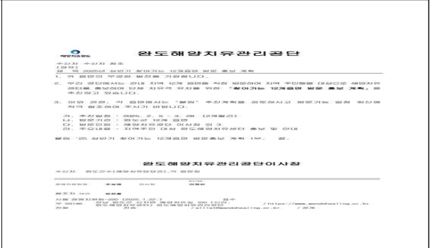
「찾아가는 해양치유」 봉사